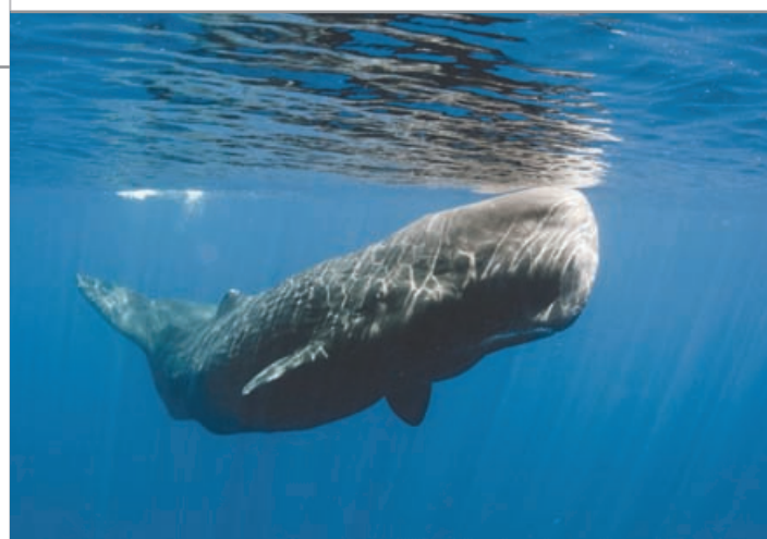
Figura 4.12 En el razonamiento deductivo anterior, obtenemos una premisa verdadera: La ballena no es pez.

Pero hay que advertir que esto mismo no se cumple en todos los silogismos categóricos, pero tampoco en otros tipos de razonamientos como los siguientes: