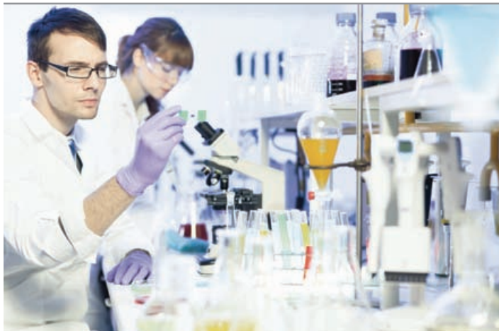
Figura 4.15 El argumento inductivo funciona en las llamadas ciencias experimentales.

Podremos advertir que la conclusión (generalización) obtenida en el ejemplo anterior representa una ley científica, es decir, indica una relación constante entre las propiedades de los metales con la conducción eléctrica. Asimismo notaremos que el argumento inductivo funciona de manera frecuente y fructífera en las llamadas ciencias experimentales como la física, la biología y la química.