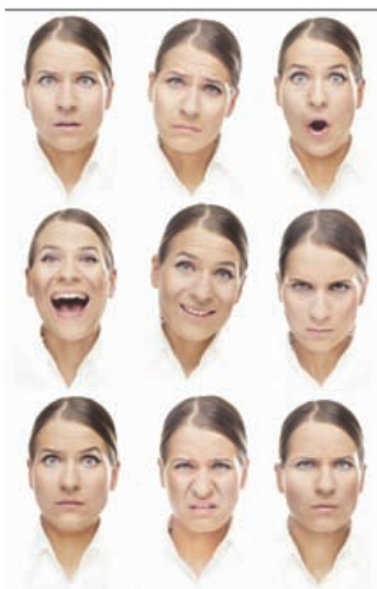
Figura 4.11 En la interpretación del significado de los argumentos intervienen aspectos como los estados de ánimo entre otros.

Ya desde los orígenes de la lógica, con Aristóteles, se le daba especial preferencia a un tipo de razonamiento o argumento llamado deductivo . Por lo general, se ha caracterizado el razonamiento deductivo como aquel que parte de enunciados más generales para concluir con enunciados menos generales . Esta característica se cumple en la inmensa mayoría de los silogismos categóricos, pero en otros no se cumple, como por ejemplo en las formas